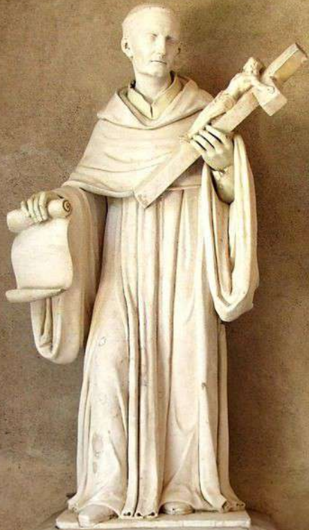
Statue de Bernard de Clairvaux, Maison natale de Saint Bernard de Clairvaux, Fontaine-lès-Dijon