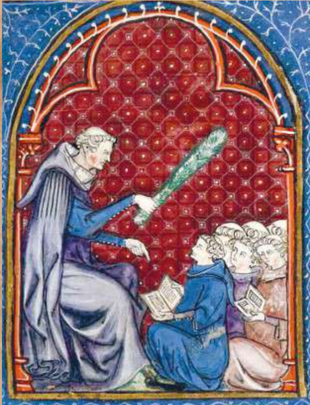
Gossuin de Metz, Image du monde , conservé à la BNF, 574, fol. 27 (XIV ème siècle).