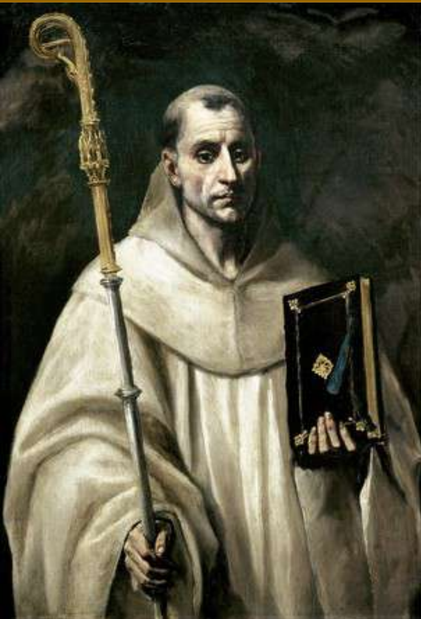
Portrait de Saint Bernard de Clairvaux, peint vers 1615 par l'espagnol El Greco. Actuellement conservé au Musée de l'Hermitage à Saint-Pétersbourg (Russie)