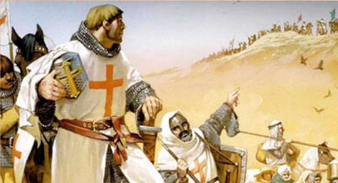
Chevaliers templiers près de Jérusalem. Dessin par Angus McBride pour la revue Osprey.

Qu'obtient Bernard de Clairvaux lors du Concile de Troyes (1129) ?